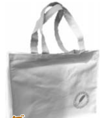
⑦ 買い物バッグ (縦:30・横:35・マチ:13) 800円