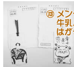
⑬ メンタル柵原 牛乳バックで作った はがきとしおりのセット 150円