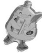
③ みしゃモンバッジ (美咲町社協キャラクター) 400円