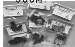
⑭ アニマルストラップ (ホエボランティアの会) 300円