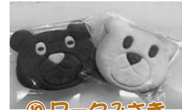
⑩ ワークみさき くまさんクッキー (黒・白) 120円