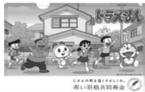
⑧ ドラえもんクリアファイル 200円