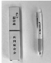
① ボールペン(黄緑) 100円