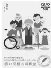
⑤ クオカード→ (500円分) 1000円