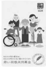
←④ 図書カード (500円分) 1000円