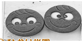
⑪ ひがり学園 さつきの丘 コーマスくんクッキー 130円