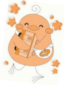
美咲町社協のキャラクター「みしゃモン」

知る人は知っているが、知らない人にはゼンゼン知られていない、地域の「こんな活動」を紹介します。興味が湧いたら…、チョッと参加してみよう…と、気持ちが揺らいだ方は、是非是非【お問い合わせ】等に連絡してみてください。