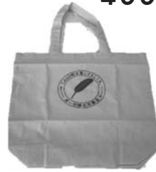
⑥ エコバッグ (縦:36・横:35・マチ:10) 400円