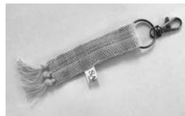
⑫ さくらの実 さをり織りのストラップ 350円