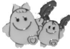
② 共同募金キャラクターバッジ (愛ちゃんと希望くん) 400円