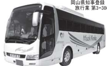
岡山県知事登録 旅行業 第3-386号

本社：〒709-3703 岡山県久米郡美咲町打穴中1030-1 ☎0868-66-7718(代) FAX.0868-66-2511