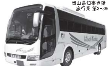
岡山県知事登録 旅行業 第3-386号

本社：〒709-3703 岡山県久米郡美咲町打穴中1030-1 ☎0868-66-7718(代) FAX.0868-66-2511