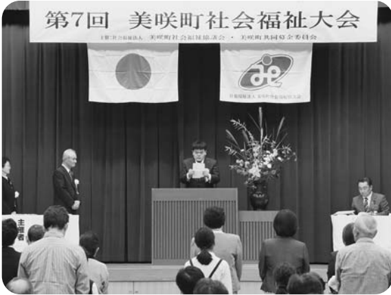
受賞者代表あいさつ