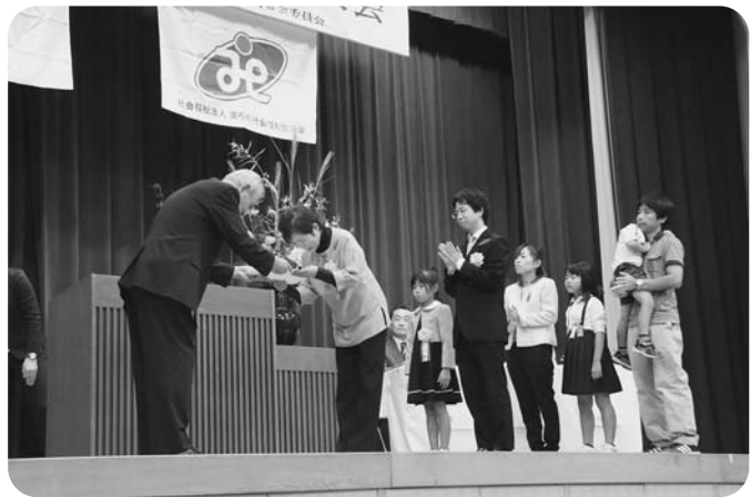
募金箱応募者の表彰の様子