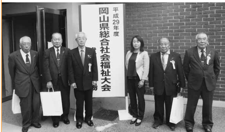
当日ご出席された方々です。

平成29年10月5日(木)岡山市民会館にて平成29年度岡山県総合社会福祉大会が開催され、次の方々が長年の福祉活動の功績により表彰されました。受賞者の皆さん、誠にありがとうございます。