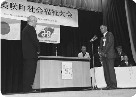
受賞者代表あいさつ