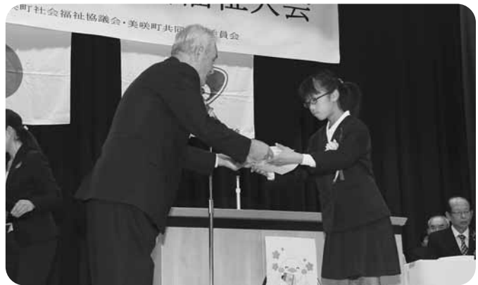
募金箱応募者の表彰の様子