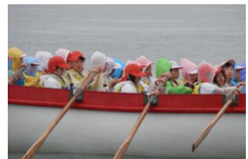
風雨の中でのカッター漕ぎ

したが、とても思い出に残る貴重な経験となったのではないのでしょうか。この学習で学んできた「みんなで力を合わせることのすばらしさ」や集団行動や決まりを守ることの大切さ」「厳しい環境の中でもやり遂げた時の充実感」等を、今後の学校生活の中でもしっかり生かして行ってほしいと願っています。