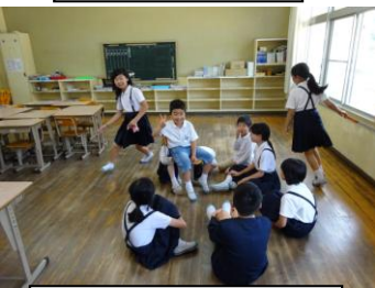
縦割り班遊び (ハンカチ落とし)