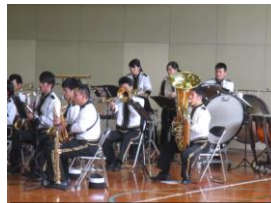
県警音楽隊の演奏

「フリー参観日」の日の三、四校時目、「岡山県警察音楽隊」約三十名が演奏に来てくださいました。