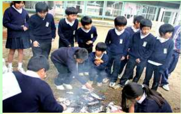
チャレンジクラブ