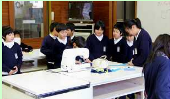
ハンドメイドクラブ