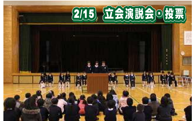
2/15 立会演説会・投票