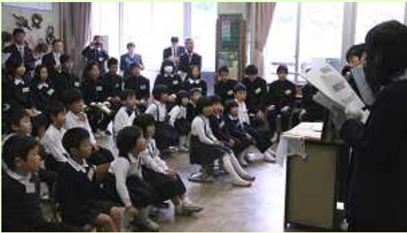
合同授業(小1生活科・中2学級活動)

旭 中学校と連携しながら、学力の向上や学習習慣の確立・豊かな心の育成をめざして取り組んでいるところですが、11月18日(金)に、その一端を研究発表会として授業公開しました。