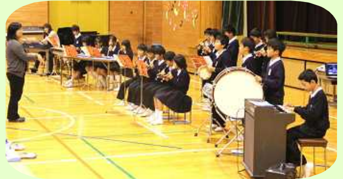
5年生：合奏『ヘビーローテーション』