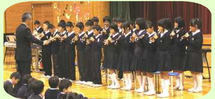
6年生：リコーダー奏『メヌエット』