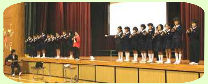
4年生：リコーダー奏『オーラリー』