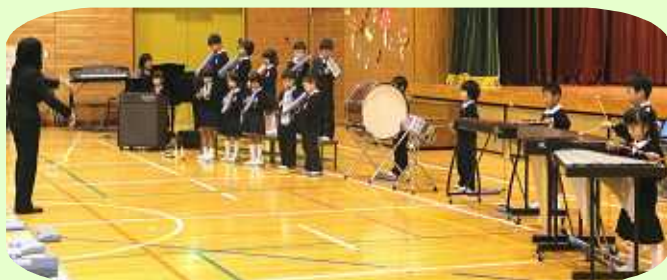
1年生：合奏『きらきら星』