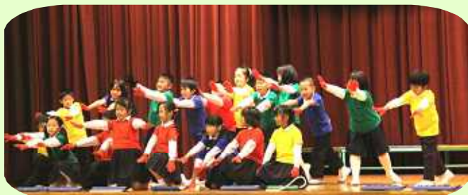
2年生：音楽ものがたり『スイミー』