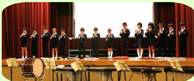
3年生：リコーダー奏『明日の明日は』