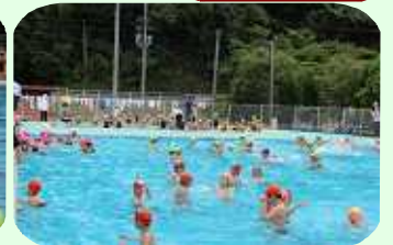
水泳シーズン開始！