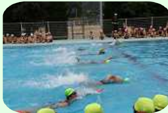
5・6年による模範水泳