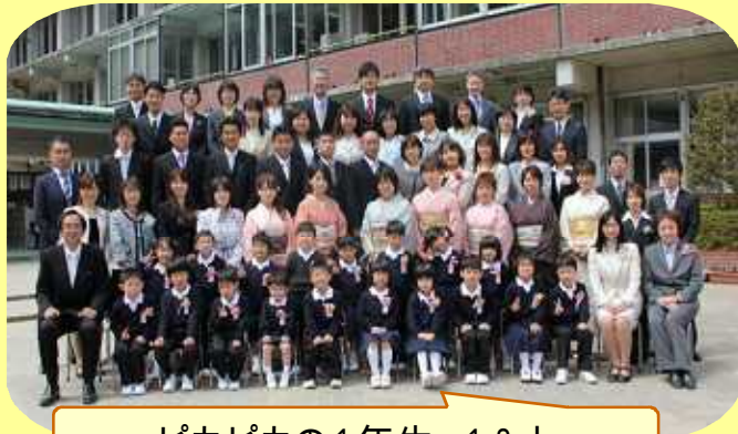
ピカピカの1年生 18人