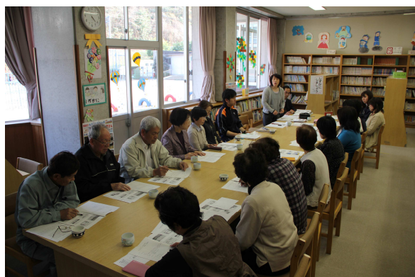
ボランティア研修会

ボランティア研修会では、本年度ボランティア登録をいただいた方々を対象に学校支援本部のねらい、小学校の様子、活動内容や注意事項、守秘義務等について研修を行いました。