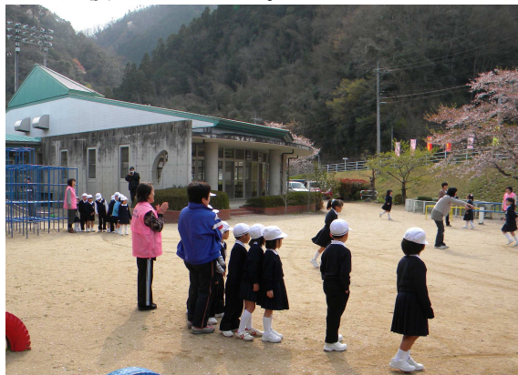
朝遊び「ぐるぐるじゃんけん」(1年生)

毎日数名のボランティアが、4月18日から5月6日までの間、子どもたちと担任、学年担当教員が行う、朝遊びの時間に安全・見守りとして支援に入りました。