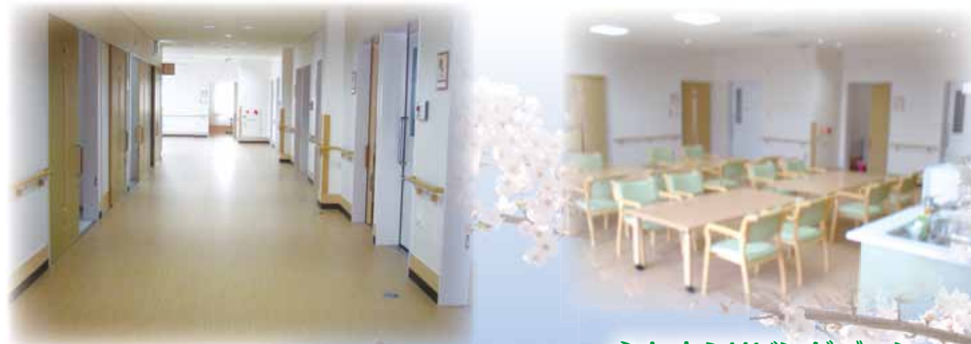
心むすぶリビングゾーン