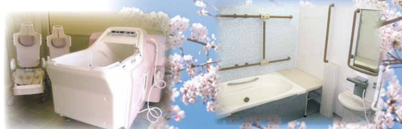
特別浴槽でリフレッシュ